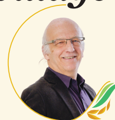
Par Simon Bégin